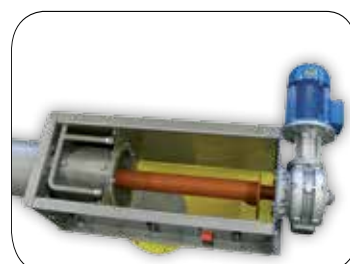
Vista alto scarico GCP