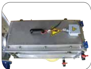
Modulo scarico isolato