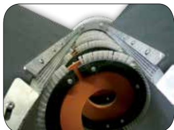
Vaglio con paraspruzzi